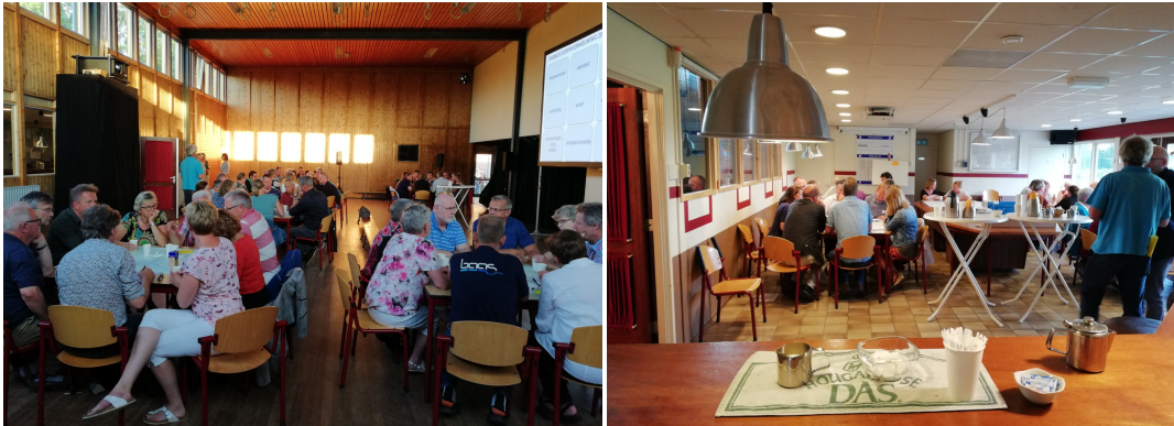
In elf groepen werden de thema's voor het dorpsvernieuwingsplan verkend.

het dorpsvernieuwingsplan zal zeker volop aandacht aan Ten Post-Kröddeburen, Winneweer en Wittewierum worden besteed.